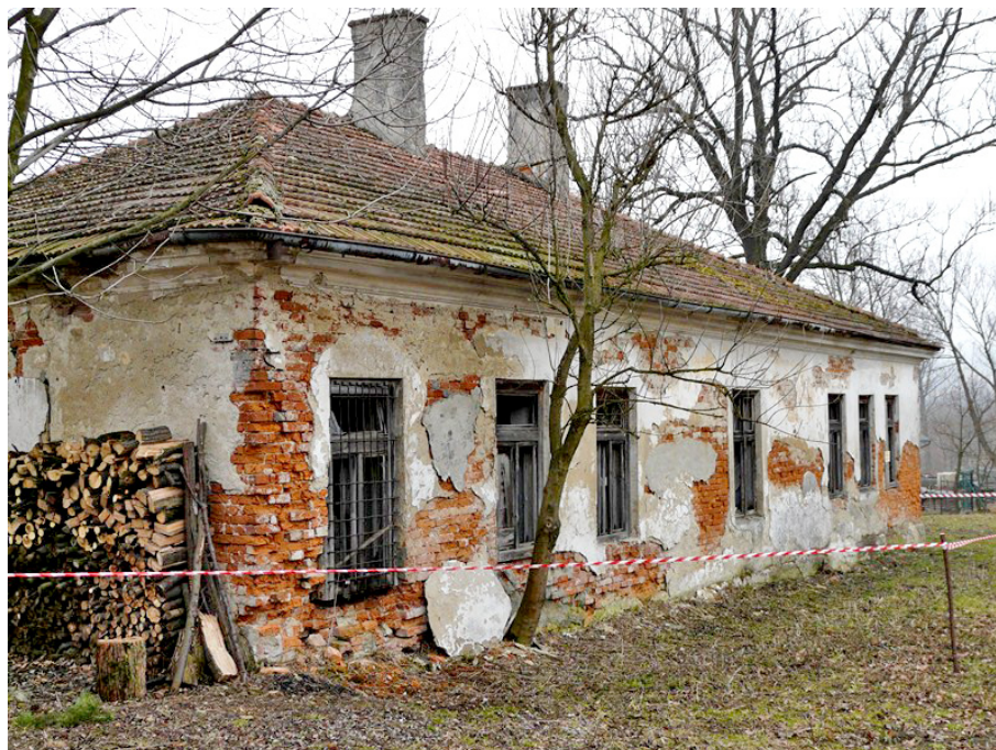
Zdjęcie nr 10

Wnętrze budynku dworu w Żeglach po pożarze z 1 maja 2013 r.