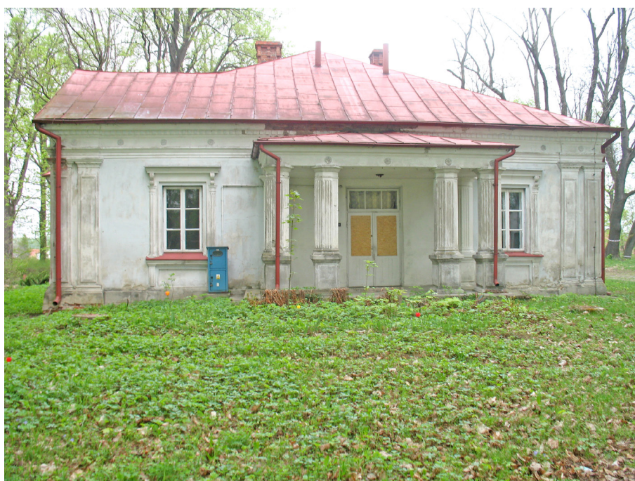
Dwór w Starym Dzikowcu